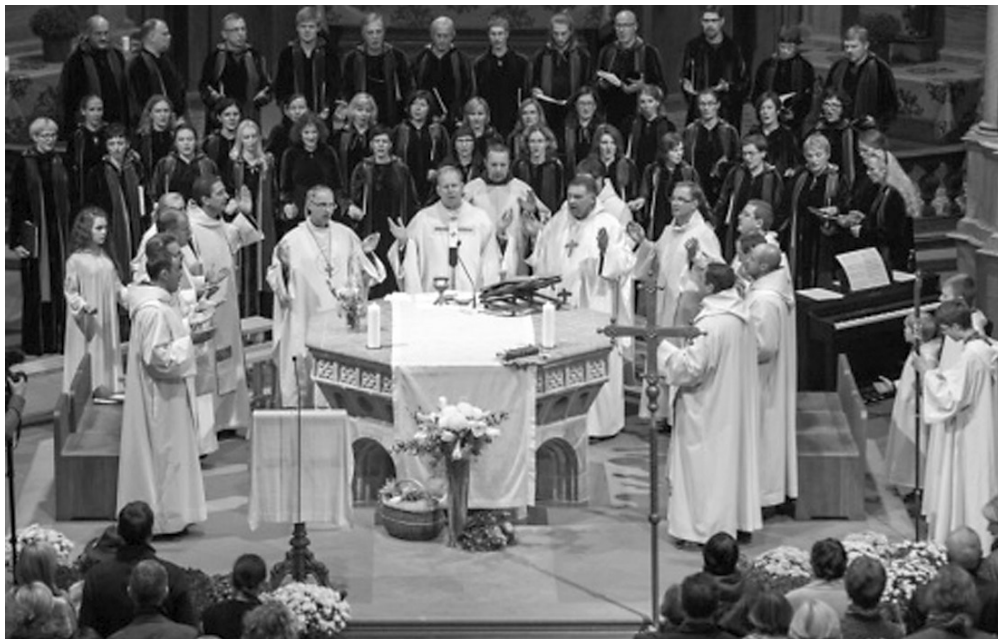
Vilniaus Šv. Pranciškaus Asyžiečio (Bernardinų) parapija