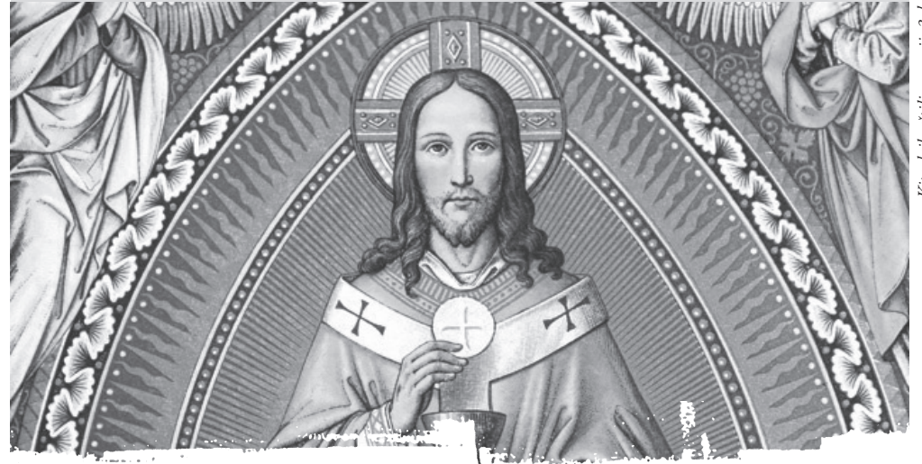
Kūnas laikrasteis – rugsėjo 3 d.

Nr. 668 ŠVČ. KRISTAUS KŪNAS IR KRAUJAS • DEVINTINĖS 2017 birželio 18 d.